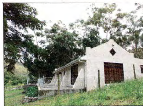
Die Kloof, 'n ideale wegbreekplek op die platteland so onder die eikebome. Verskeie paadjies bied toegang tot die kloof.

"Ons het die plek vir die skoonheid daarvan gekoop; sonder om regtig te weet wat ons daarmee gaan doen," vertel sy. "My hart het so hard begin klop toe ons oor die berg B'bos toe gery het. Ons motor het in die sandpaaie vasgeval en ons moes stap, maar ek was oortuig ons hoort hier. Veral met my grootste liefde: plante."